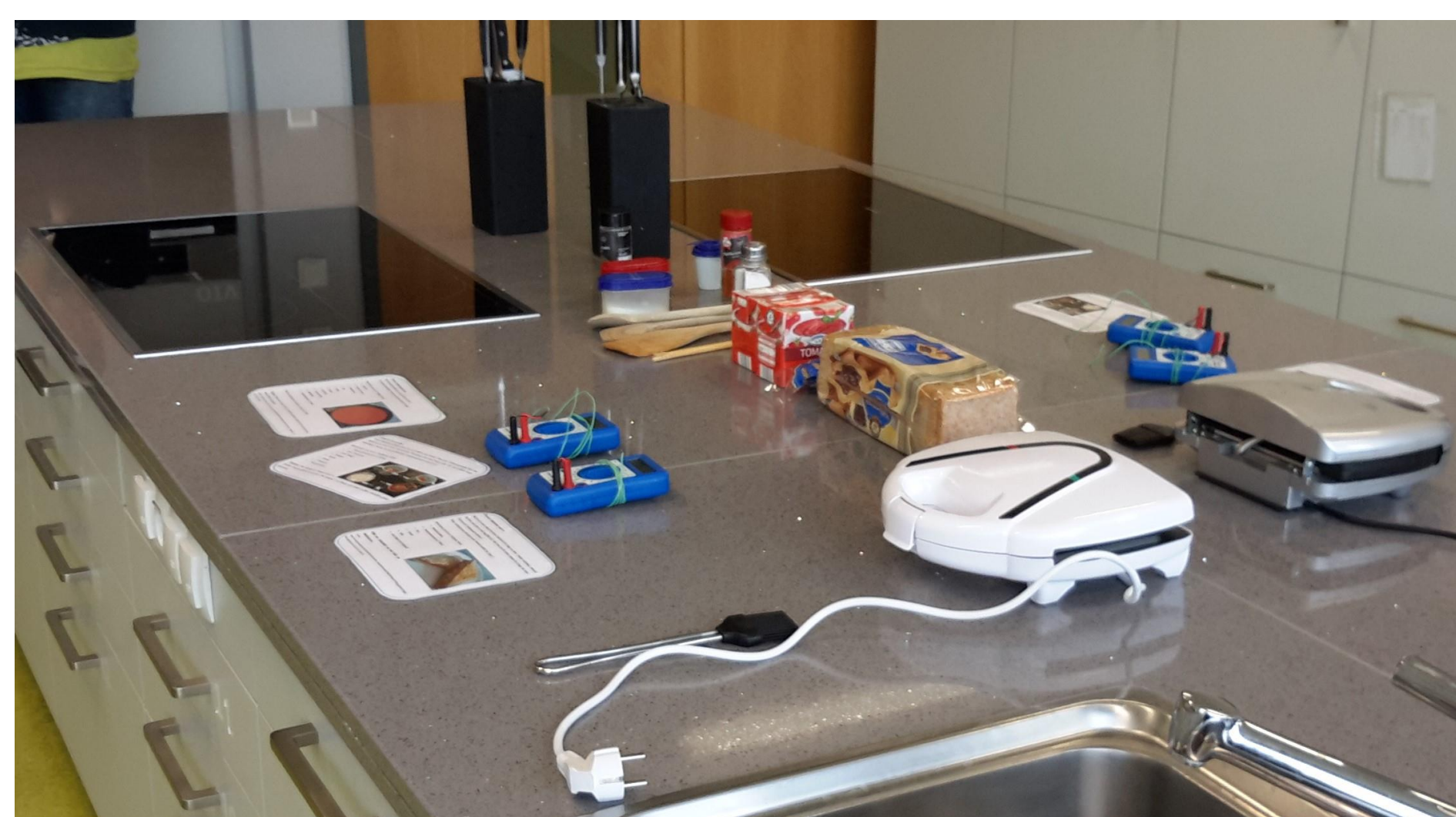
Abb.1 Bereitgestellte Lernumgebung.